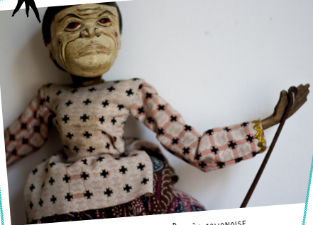
WAYANG GOLEK - POUPEE JAVANAISE TROUVÉE LORS DE MON VOYAGE EN INDONÉSIE EN JUILLET 2017