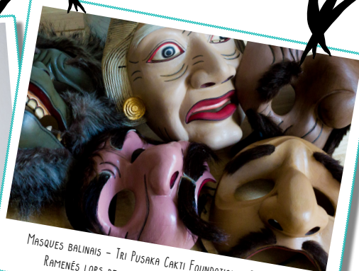
MASQUES BALINAIS - TRI PUSAKA CAKTI FOUNDATION - BATUAN, BALI RAMENÉS LORS DE MON STAGE DE TOPENG EN JUILLET 2017